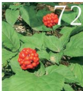
Ricaricatevi con il ginseng